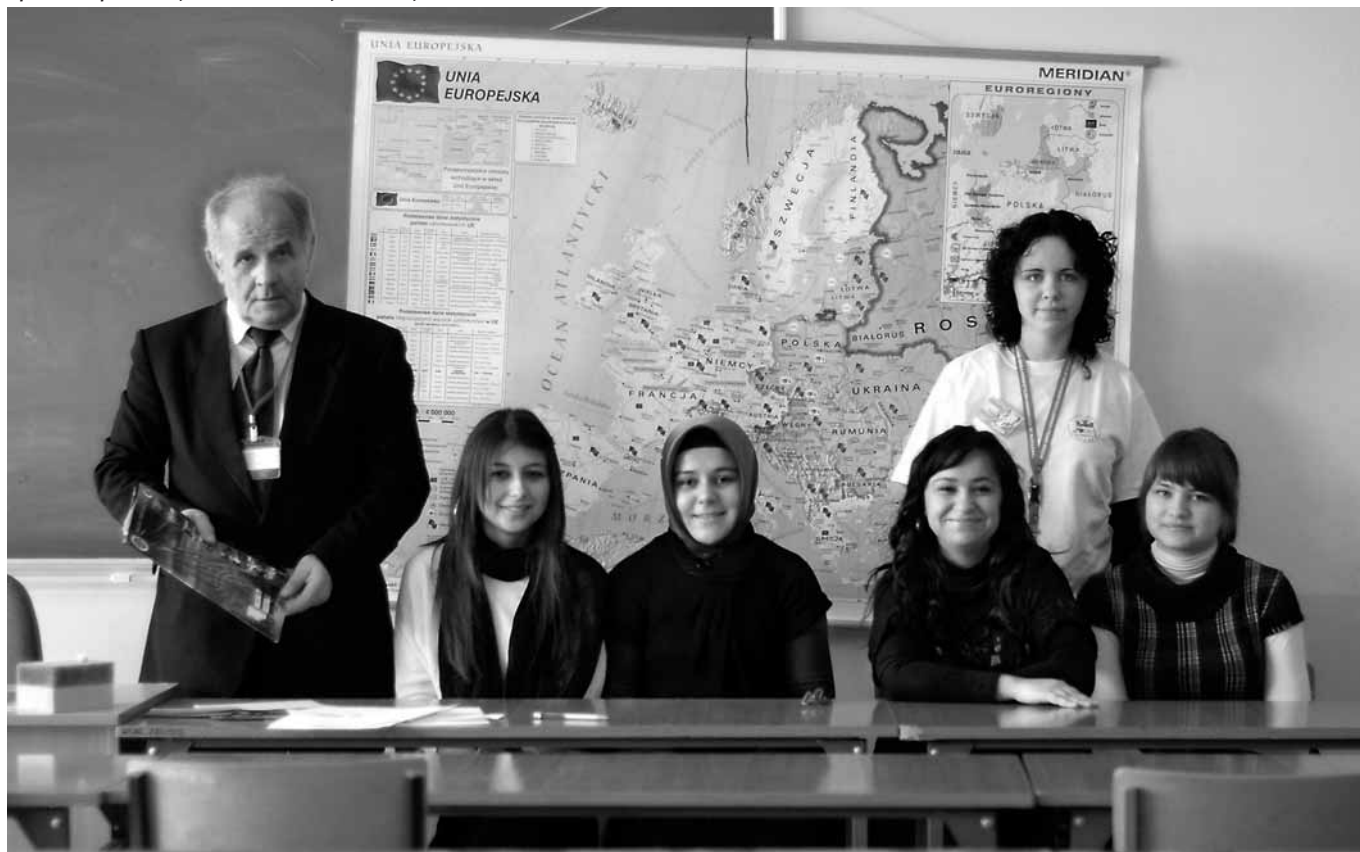
Spotkanie-prezentacja „WSHE w Turcji — Turcja w WSHE”

..... że brak i rzekł ....., że brak ..... śledzi, ale rzeki ..... i gdy tylko będzie w stanie, to o świcie z łózka ..... po czym ruszy ..... i w zdobyciu ryb ..... Odtąd student nasz ..... zamiast smacznych ryb je dynie.