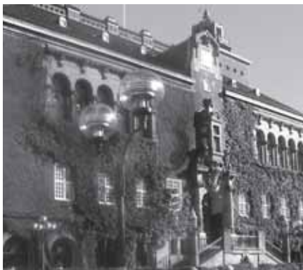
Ratusz w Borås