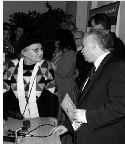
Jarosław Kaczyński w rozmowie z uczestnikami debaty obywatelskiej

— Leszek Miller, były premier RP (9 czerwca), który wygłosił wykład pt. „W 5-lecie Polski w Unii Europejskiej — doświadczenia i perspektywy”.