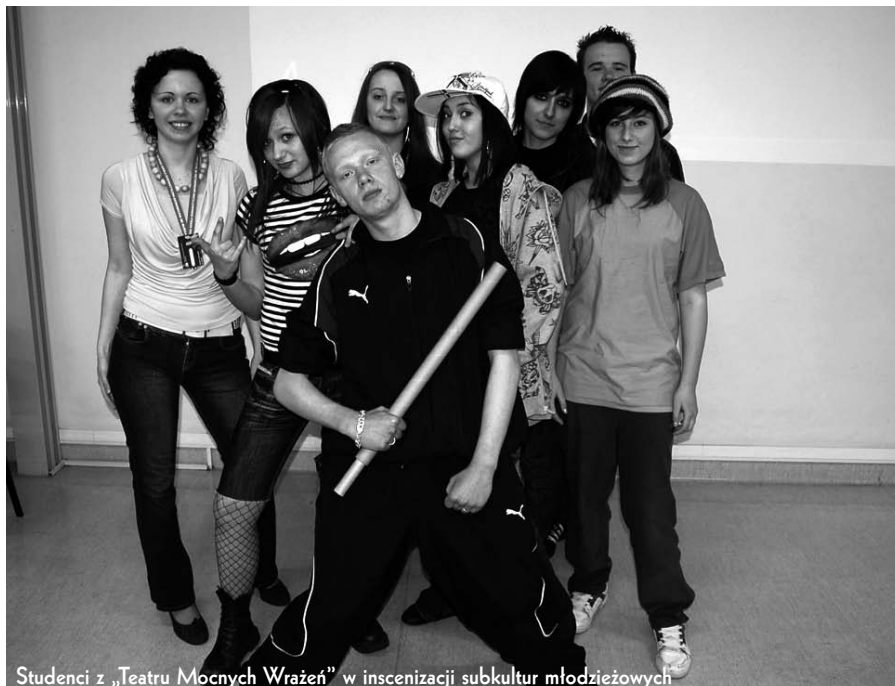
Studenci z „Teatru Mocnych Wrażeń” w inscenizacji subkultur młodzieżowych