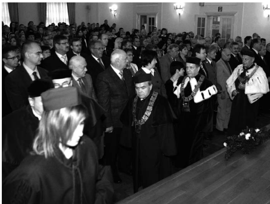
Wejście członków Senatu WSHE poprzedzające uroczystość Inauguracji roku akademickiego

— powołanie nowej jednostki pod nazwą Studium Języka Polskiego i Kultury. Decyzją Rektora kierownictwo studium objął zastu-