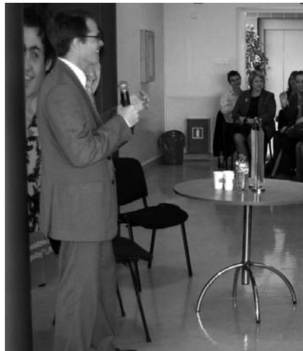
Konsul ambasady USA w Polsce Andrew Hay

W roku 2009 ambasada USA w Warszawie i konsulat amerykański w Krakowie wspólnie z Ministerstwem Spraw Zagranicznych RP i instytucjami w całej Polsce obchodzą 90. rocznicę ustanowienia stosunków dyplomatycznych między Polską a Stanami Zjednoczonymi. WSHE włączyła się w działania popularyzujące rocznicę i zaprosiła na spotkanie z konsulem ambasady USA Andrew Hayem, który zaprezentował tę tematykę 8 czerwca br. studentom oraz uczniom szkół gimnazjalnych i ponadgimnazjalnych. Organizatorem wizyty było Biuro Współpracy z Uczelniami Krajowymi i Zagranicznymi WSHE.