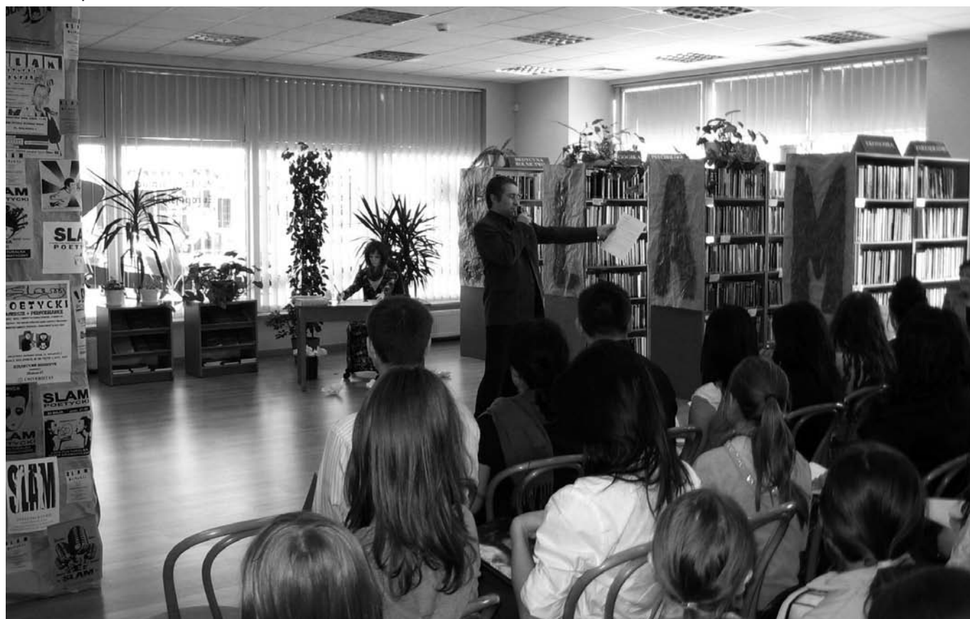
II Slam Poetycki, 3 kwietnia 2009 r.