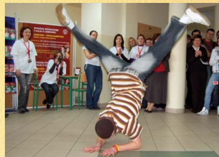
Zespół Szkół im. Stanisława Staszica w Gąbinie, 27 marca 2009 r.