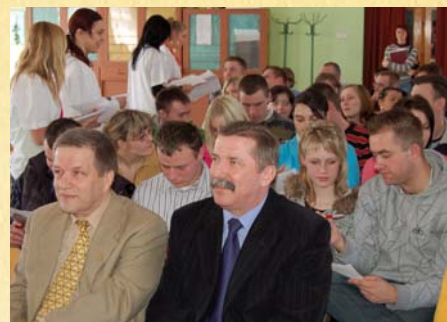
Zespół Szkół Mechanicznych w Radziejowie, 31 marca 2009 r.