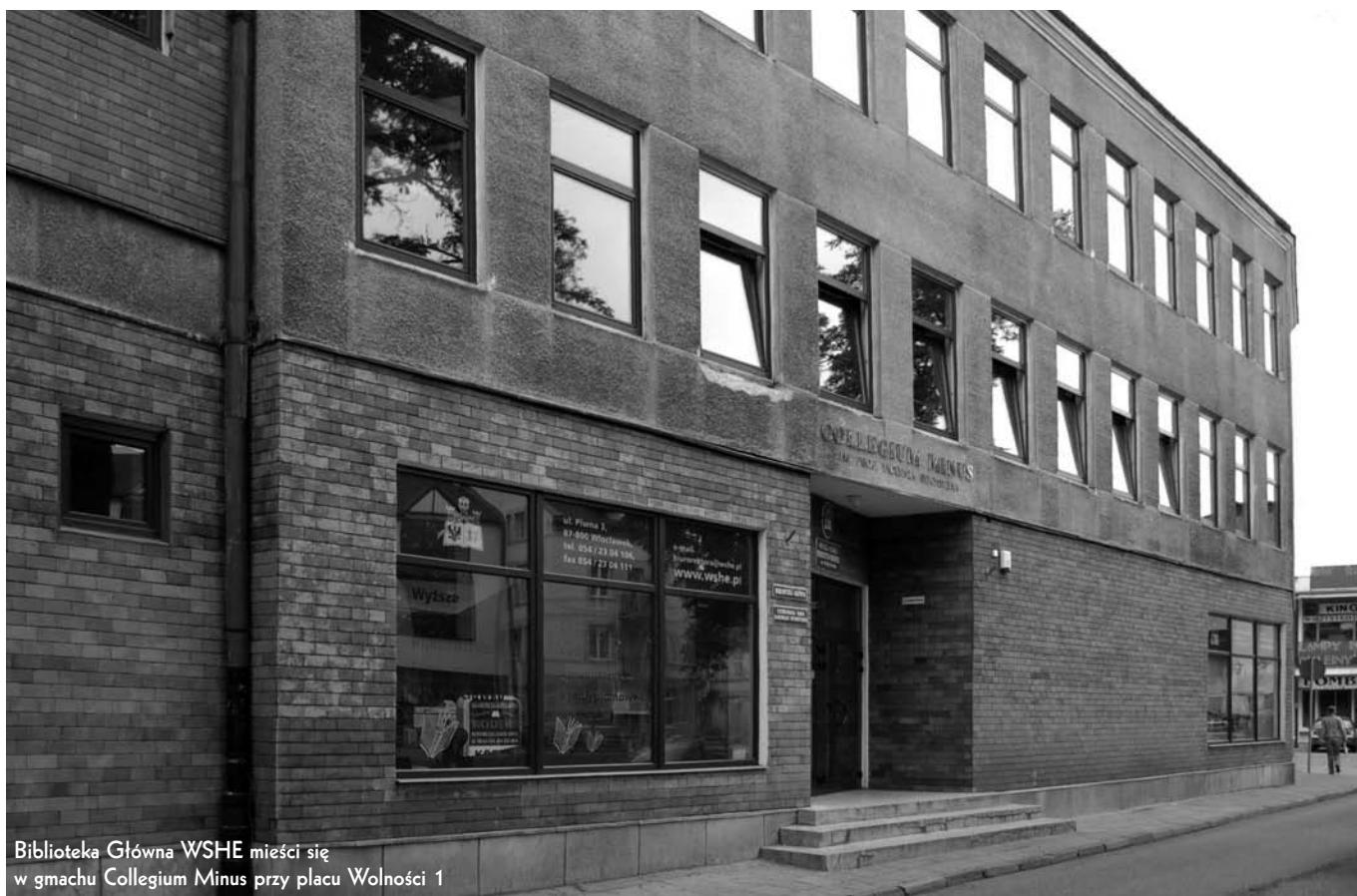
Biblioteka Główna WSHE mieści się w gmachu Collegium Minus przy placu Wolności 1

18 marca 2009 r. minęło 10 lat samodzielnego funkcjonowania Biblioteki Głównej i Archiwum Wyższej Szkoły Humanistyczno-Ekonomicznej we Włocławku. Jak każda okrągła rocznica tak i ta skłoniła do refleksji i podsumowań.