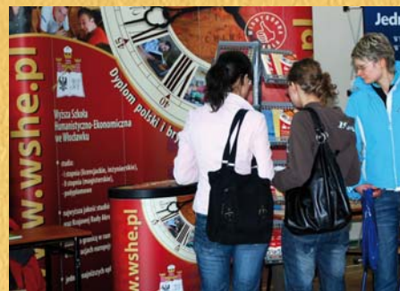
Targi Edukacyjne w Sierpcu, 18 lutego 2009 r.