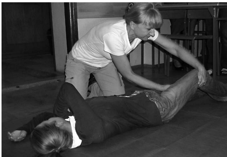
Zajęcia na kursach kwalifikacyjnych z zakresu pielęgniarstwa ratunkowego projektu „Wyższe kwalifikacje gwarancją sukcesu zawodowego dorosłych osób pracujących regionu” realizowanego przez WSHE we Włocławku w ramach Programu Operacyjnego Kapitał Ludzki