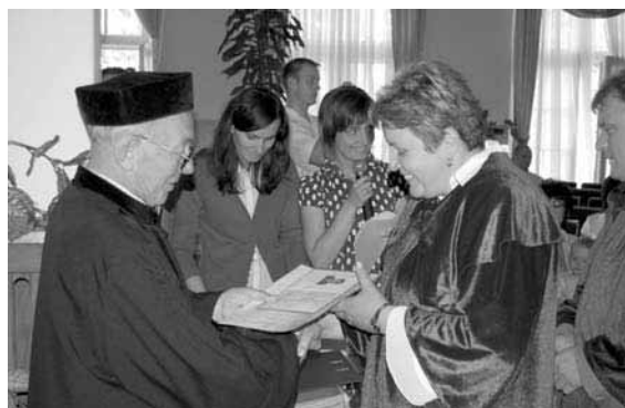
Uroczystość wręczenia dyplomów na kierunkach informatyka i ochrona środowiska, 26 czerwca 2008 r.