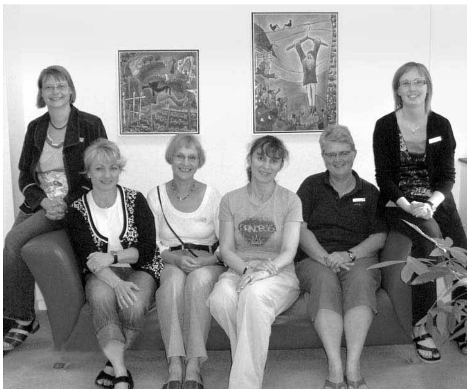
Autorka w otoczeniu nowych koleżanek

Bardzo duże wrażenie robią biblioteki publiczne w Danii. Horsens to miasto średniej wielkości. Liczba mieszkańców wynosi około 60 tys. Jednak biblioteki, jaką posiada, nie powstydziłoby się niejedno duże miasto w Polsce. Poza książkami i czasopismami bezpłatnie wypożyczane są płyty z muzyką i filmami. Dla najmłodszych czytelników przygotowano kącki do czytania, oglądania bajek z płyt dvd i do zabaw. Dzieci mają też możliwość tworzenia inscenizacji te-