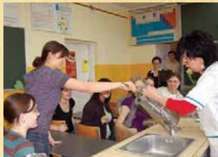
Dzień Otwarty w Radziejowie, 4 kwietnia 2008 r.