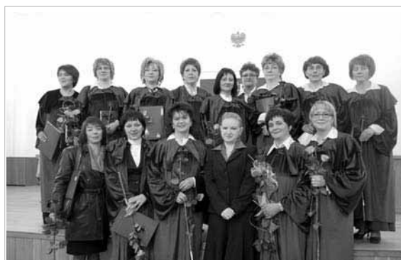
Uroczystość wręczenia dyplomów na kierunku pielęgniarstwo, 17 kwietnia 2008 r.