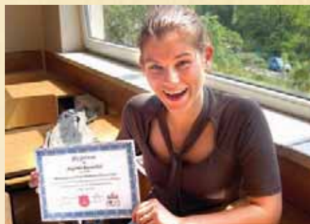
Międzygimnazjalny konkurs chemiczny, 17 maja 2008 r.