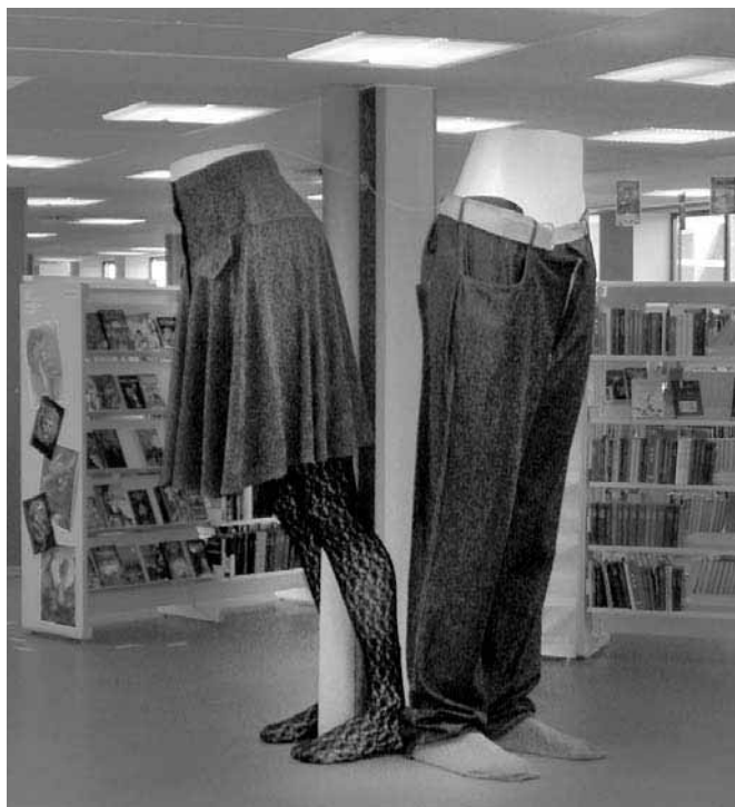
Biblioteka Publiczna w Horsens

Program wymiany Erasmus jest bardzo znanym i cenionym programem wsparcia dla chcących poszerzyć wiedzę i umiejętności.