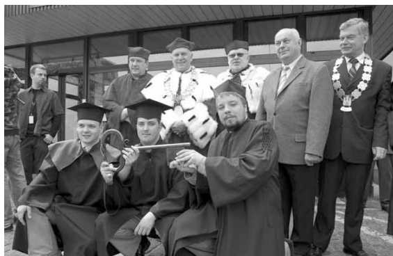
Juwenalia 2008 — inauguracja, 21 maja 2008 r.