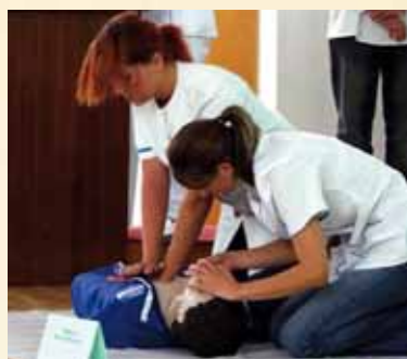
Ratuj się kto może — pokaz pierwszej pomocy