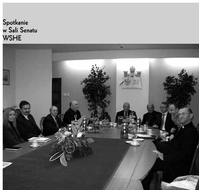
Spotkanie w Sali Senatu WSHE