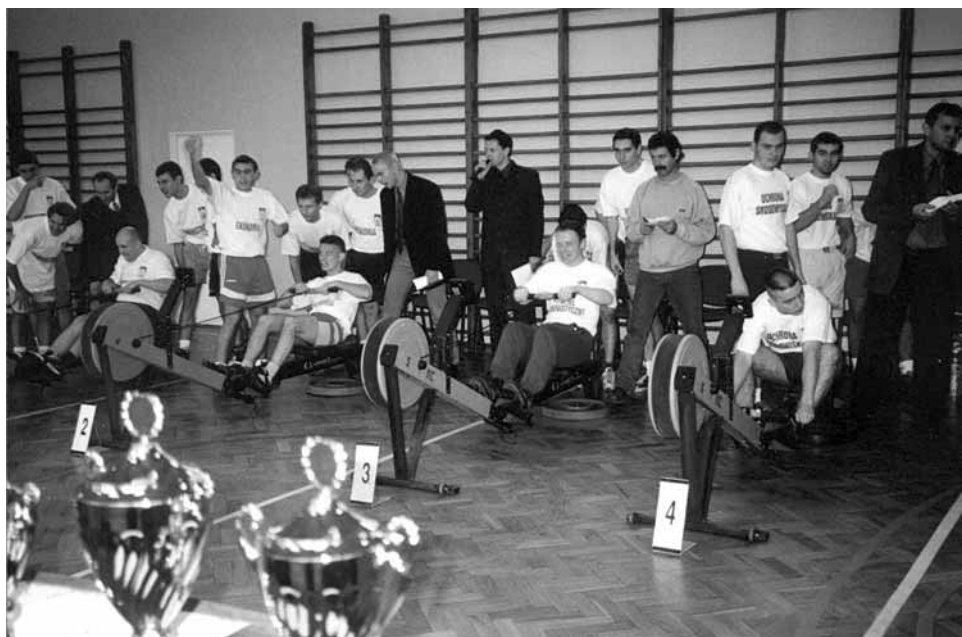
Mistrzostwa uczelni na ergometrze wioślarskim