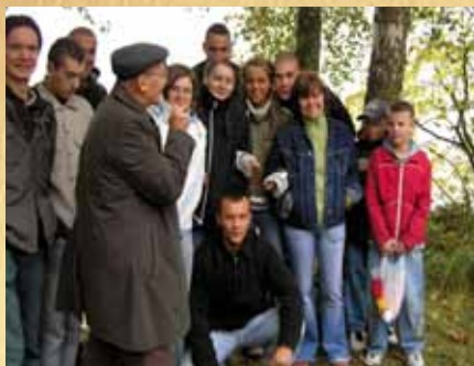
Tajemnice Zbiornika Włocławskiego — wycieczka terenowa