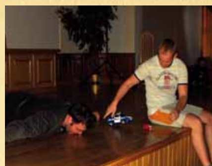
Rok, w którym pękło Niebo — koncert Teatru Studenckiego TMW