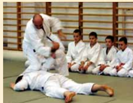
Wschodnia Szkoła Walki AIKIDO