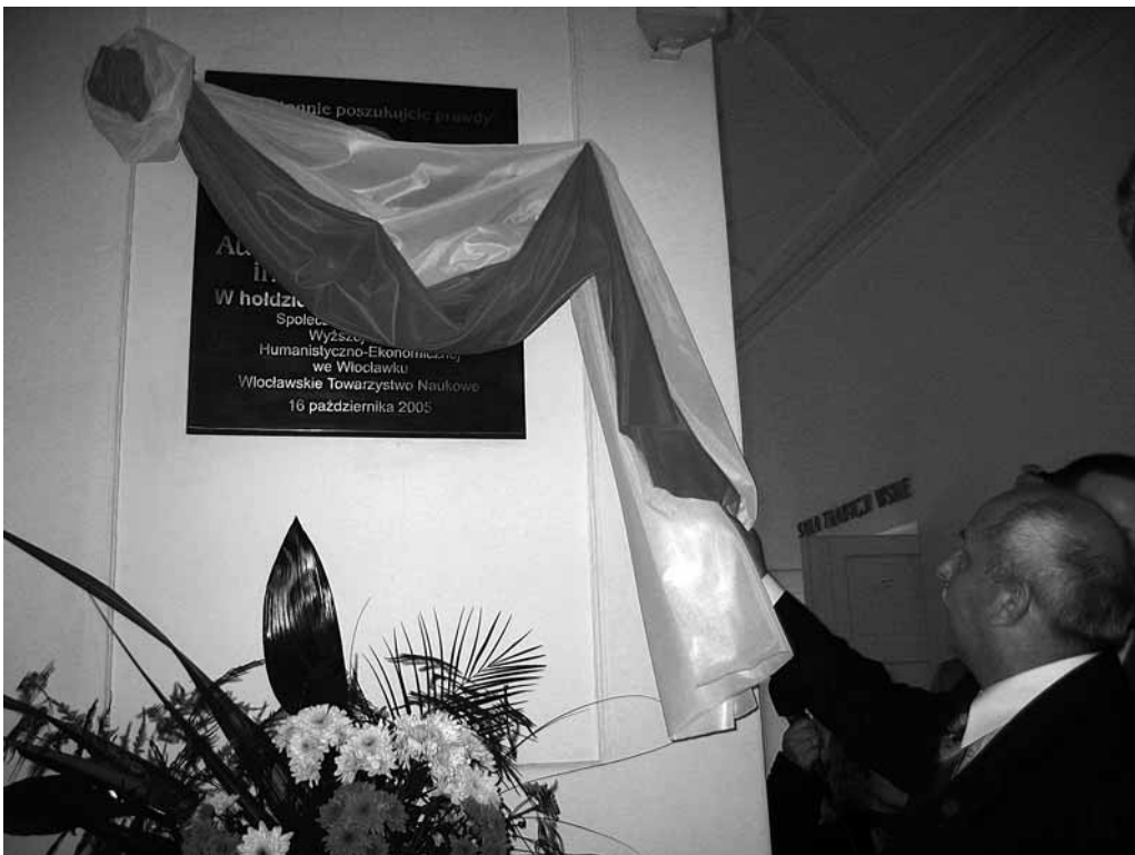
Odślonienie tablicy pamiątkowej ku czci Ojca Świętego Jana Pawła II