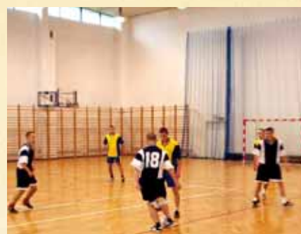
Turniej w piłkę nożną halową reprezentacji szkół ponadgimnazjalnych