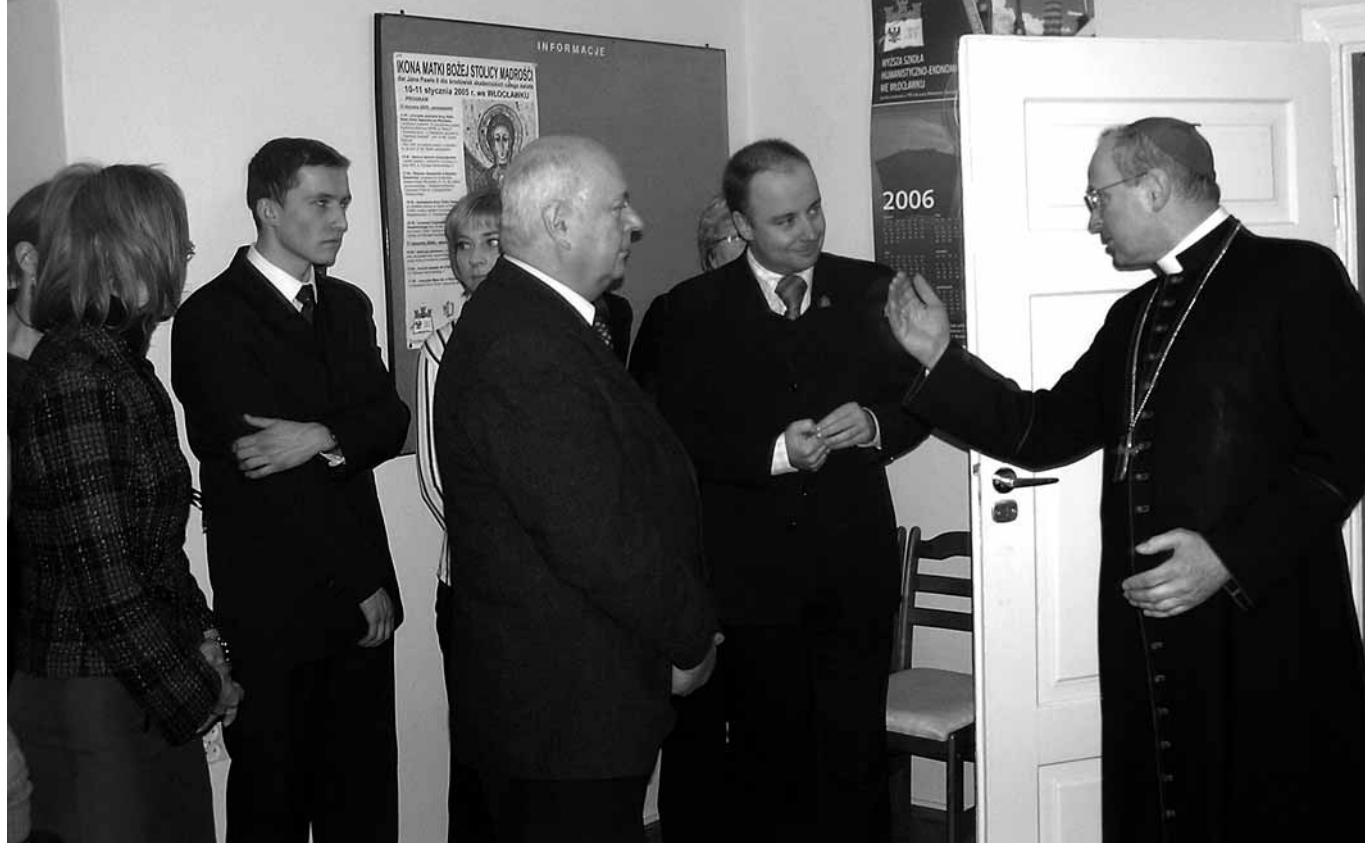
Otwarcie Diecezjalnego Ośrodka Duszpasterstwa Akademickiego