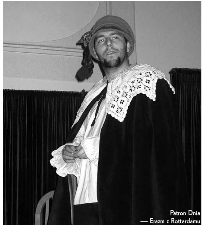
Patron Dnia — Erazm z Rotterdamu

Warto dodać, że WSHE już od ponad trzech lat uczestniczy aktywnie w programie europejskim, jest posiadaczem prestiżowej Karty Erasmosa.