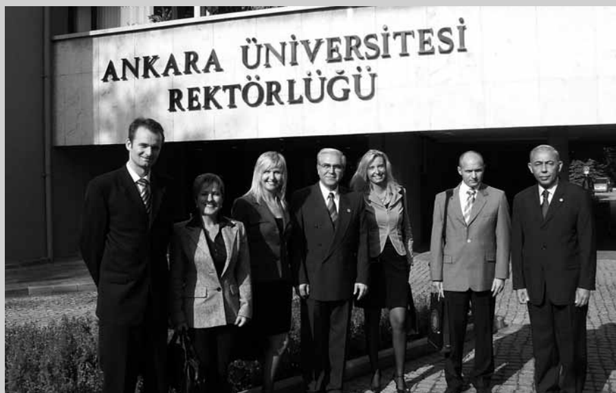
Delegacja pracowników WSHE w towarzystwie prorektora i przedstawicieli Ankara University