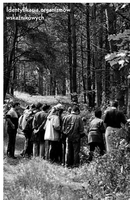
Identyfikacja organizmów wskaźnikowych