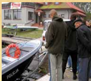
Tajemnice Zbiornika Włocławskiego — wycieczka terenowa