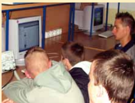
MATLAB — matematyka w komputerze — zajęcia laboratoryjne