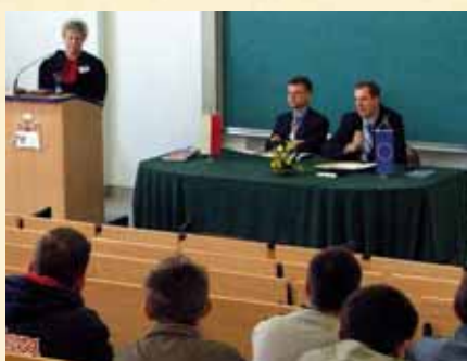
Jesteśmy w Unii i co dalej? — debata oxfordzka