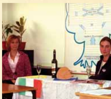
Spaghetti, pizza i risotto, czyli włoski dla każdego — warsztaty językowe