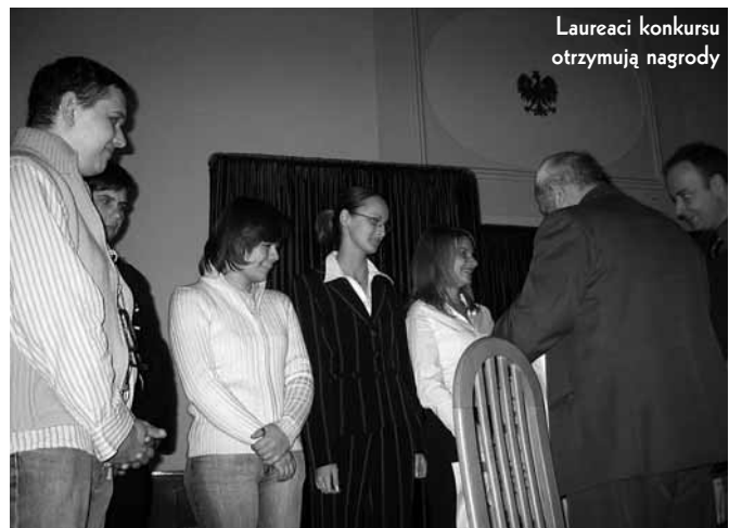
Laureaci konkursu otrzymują nagrody