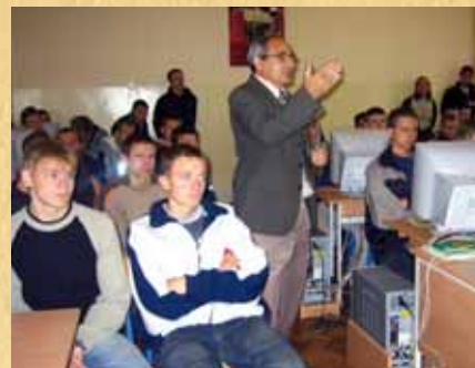
Komunikacja ponad przewodami — eksperyment, pokaz pracowni i sieci