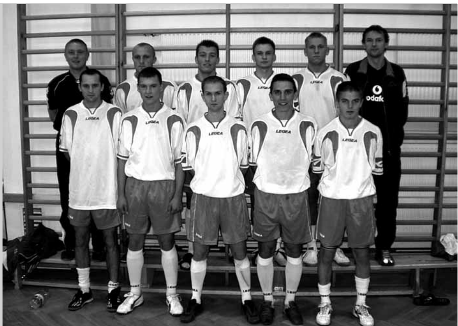
Reprezentacja AZS w futsalu, grudzień 2005 r.