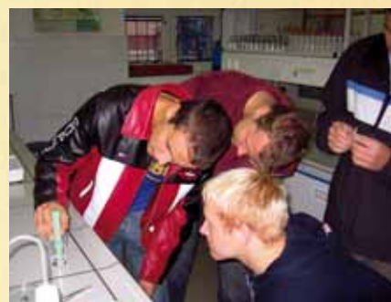
Chemia chroni, uczy, bawi — pokazy i ćwiczenia laboratoryjne