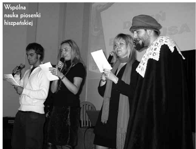
Wspólna nauka piosenki hiszpańskiej