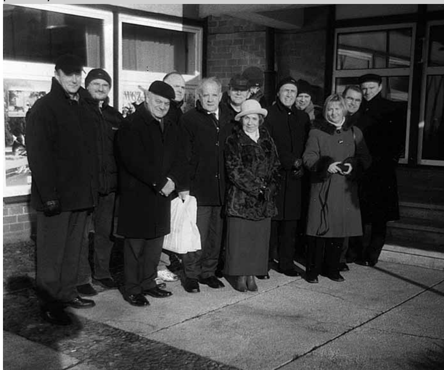
Uczestnicy konferencji podczas wycieczki