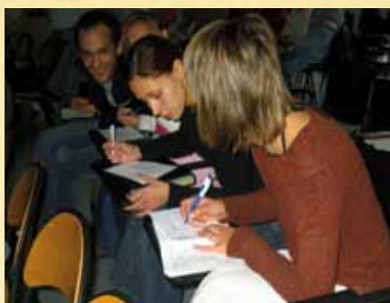
Czy to co jest to jest, czy tylko tak nam się wydaje? — ćwiczenia