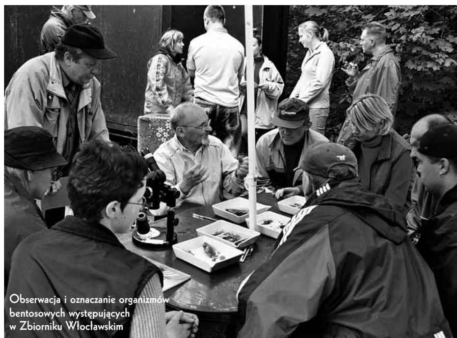
Obserwacja i oznaczanie organizmów bentosowych występujących w Zbiorniku Włocławskim

Elżbieta Falkowska