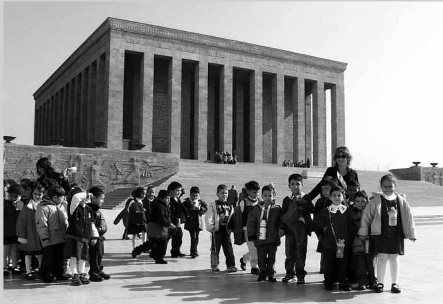
Mauzoleum Ataturka w Ankarze