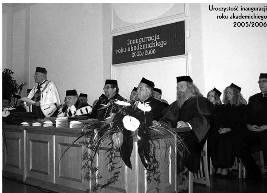
Uroczystość inauguracji roku akademickiego 2005/2006