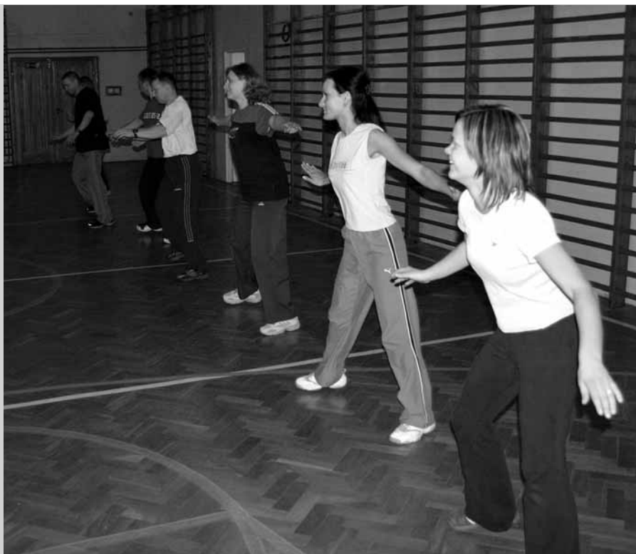
Zajęcia z grupą nauczycieli w ramach kursu doskonalącego z podstaw aerobiku