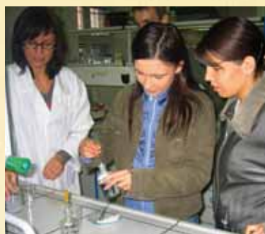
Chemia chroni, uczy, bawi — pokazy i ćwiczenia laboratoryjne